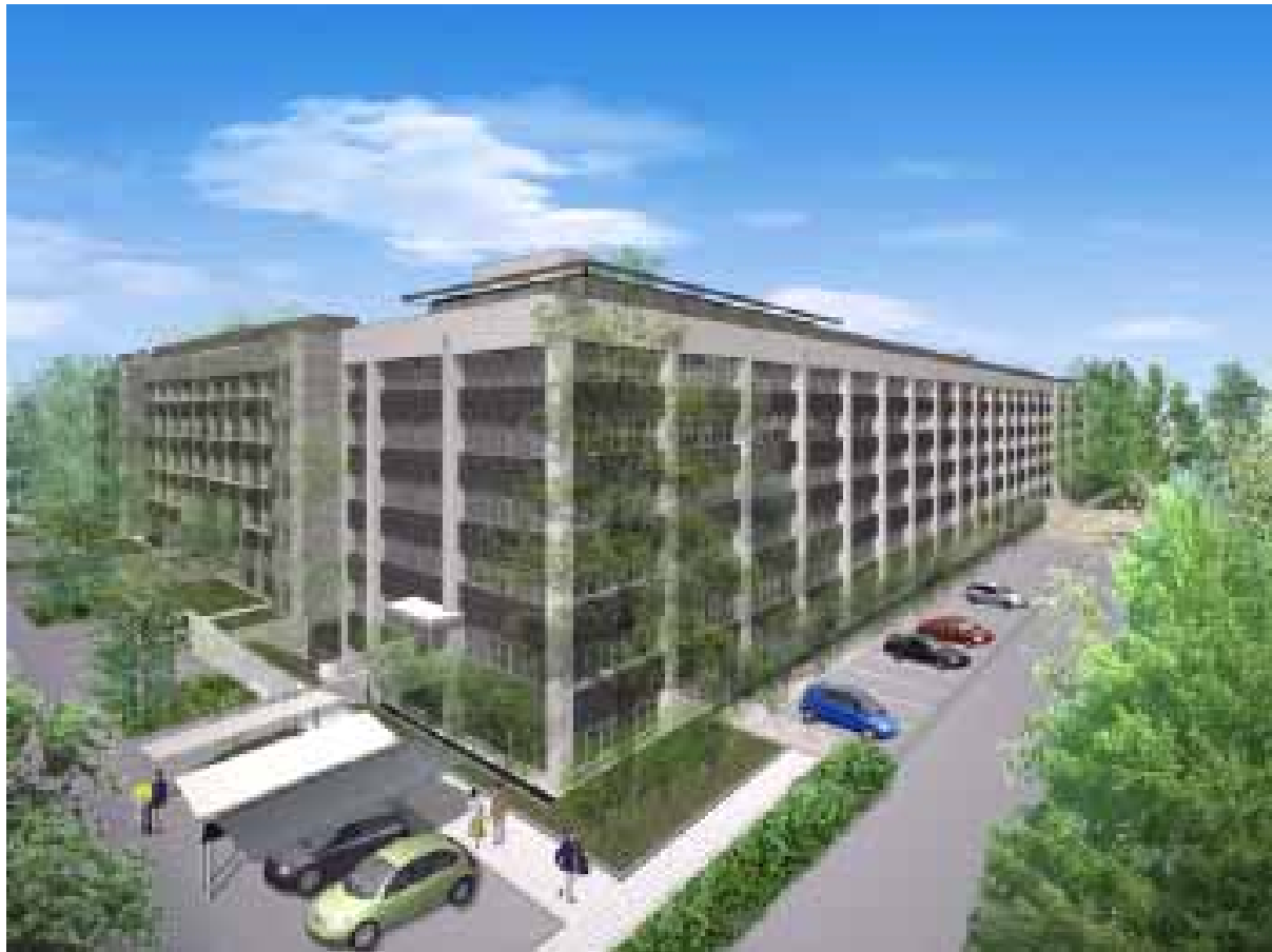
北東外観イメージ