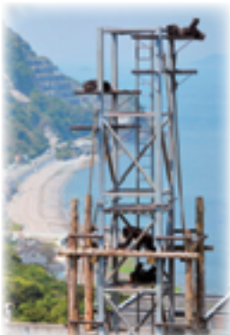
チンパンジー・サンクチュアリ・宇土